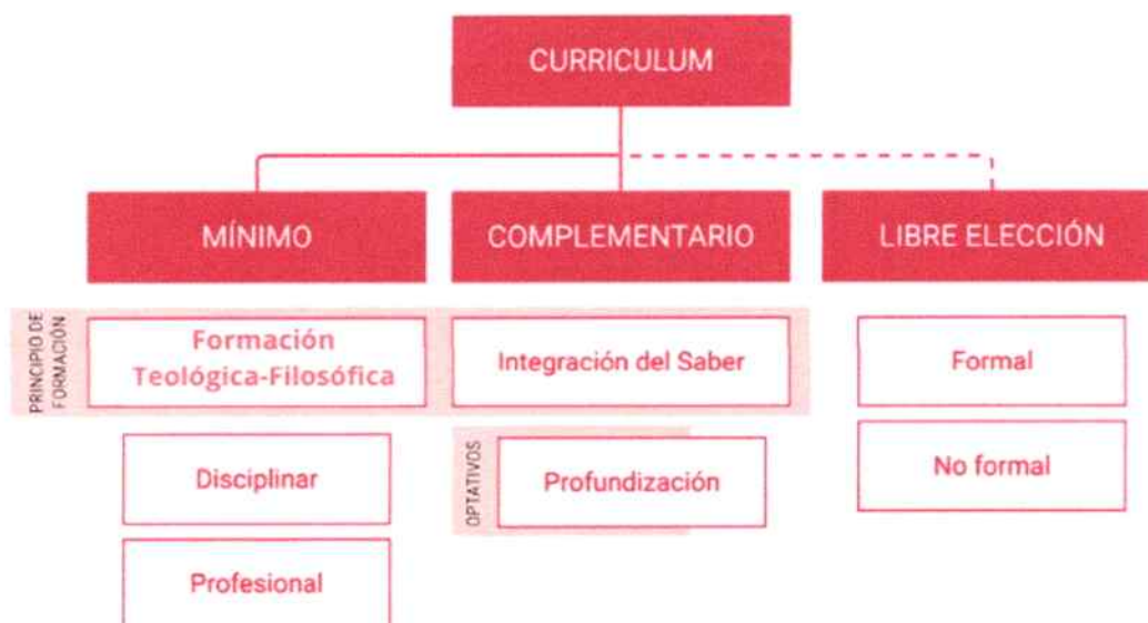
Figura 1. Descripción detallada de esta arquitectura curricular general

Estos tres componentes curriculares, articulados desde las bases de la arquitectura curricular de la UCSC, buscan garantizar una formación integral que combine una sólida base disciplinar y profesional con oportunidades de especialización y espacios para el desarrollo personal y ciudadano. Todo ello se orienta desde una concepción humanista-cristiana, inspirada en los principios del Magisterio de la Iglesia, que promueve la dignidad de la persona, el compromiso social y el bien común como fundamentos esenciales del quehacer universitario.