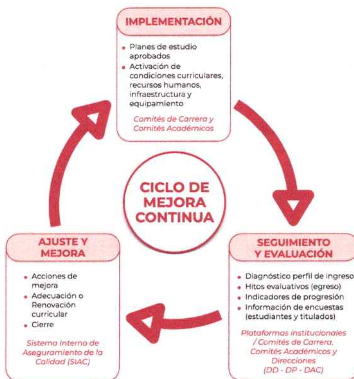
Figura 3. Ciclo de mejora continua de la oferta académica y aseguramiento del Modelo Educativo UCSC.

El ciclo de mejora continua se consolida con la evaluación sistemática del propio Modelo Educativo Institucional, a partir del análisis conjunto de los resultados globales de los procesos de seguimiento y evaluación de las distintas carreras y programas y los desafíos estratégicos de la Universidad, considerando, además, el contexto nacional e internacional de la educación superior. Sobre esa base se analiza la existencia de brechas u oportunidades de mejora y se determina si corresponde un ajuste o actualización; así, el Modelo Educativo de la UCSC se mantiene como un marco dinámico y vigente, orientador de una oferta formativa pertinente, coherente y de calidad.