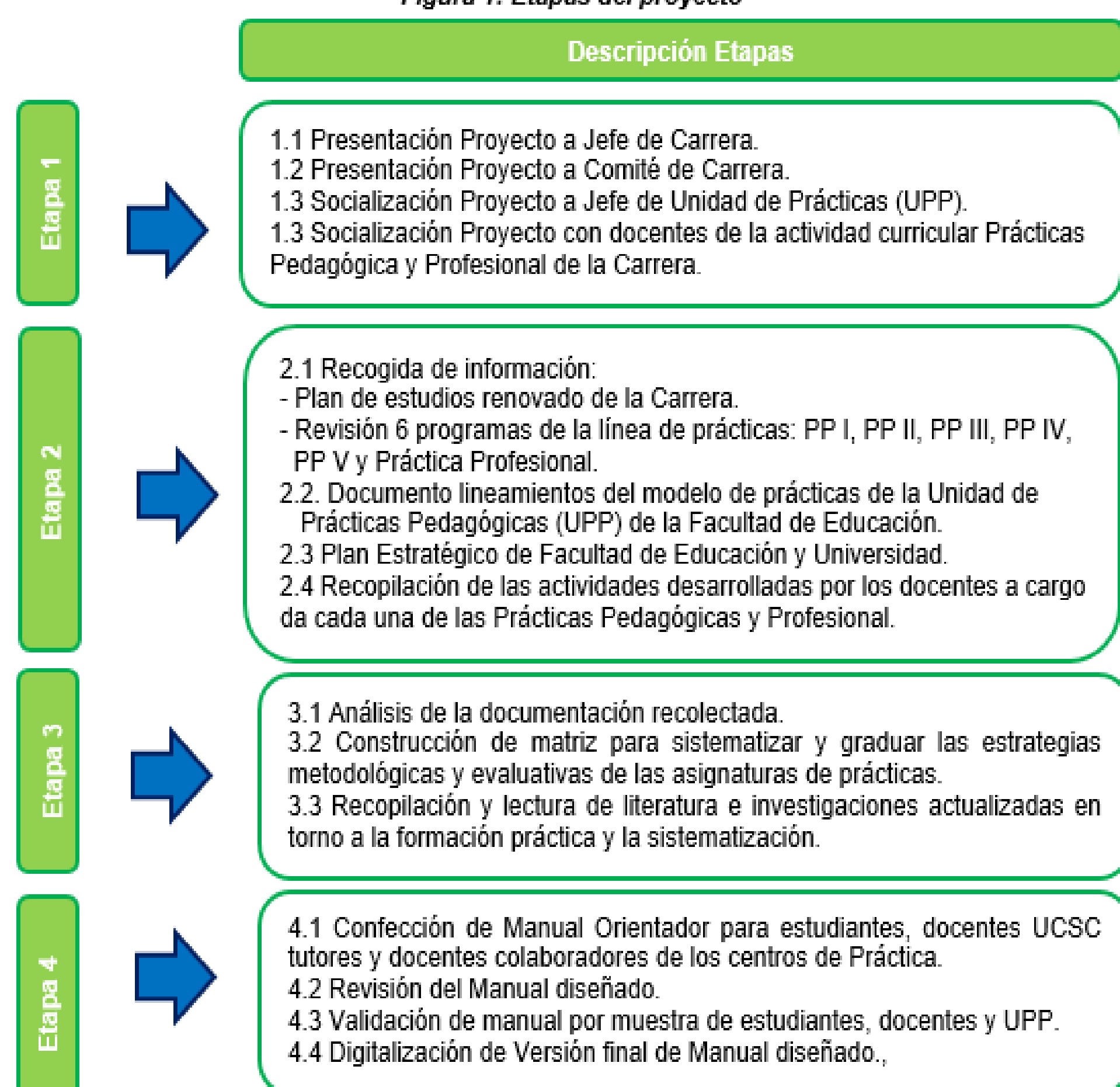
Figura 1: Etapas del proyecto